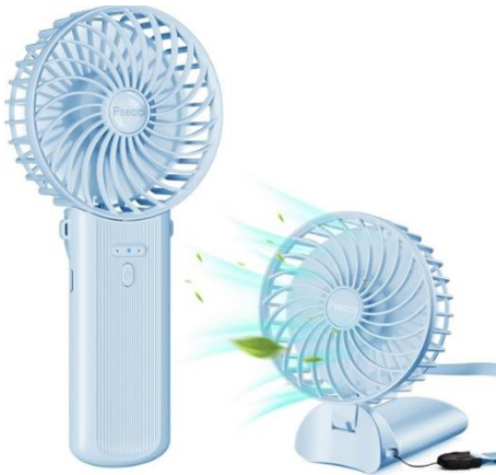
20-A： ハンディファン（USB 充電式）